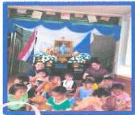
การแสดงออกถึงความรักที่มีต่อพระองค์